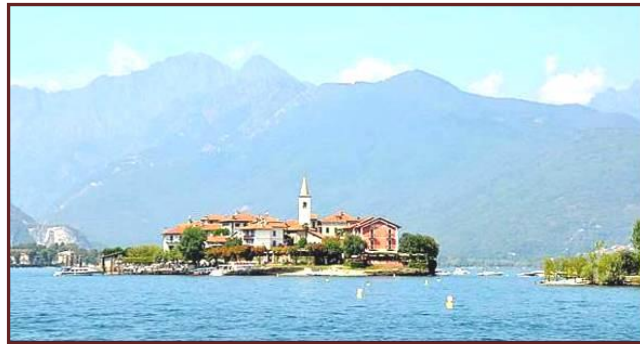
Isola Pescatori Lac Majeur