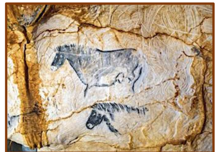
Grotte Cosquer II