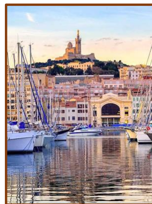
Le Vieux Port et la Bonne Mère