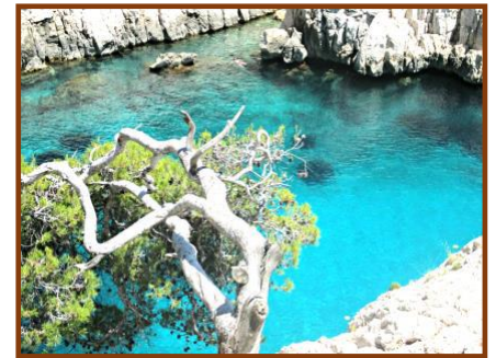
Calanque d'en Vau