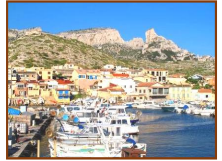
Calanque de Sormiou