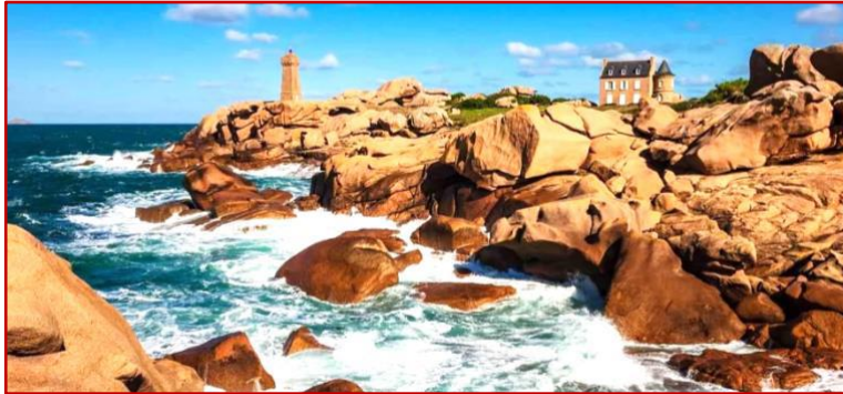
Phare de Men Ruz

Un séjour complet pour découvrir les sites incontournables de cette superbe région à la côte de granite rose, sans oublier des pauses baignade !