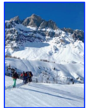
L'arrivée au lac Miroir

Au départ du télésiège de Girardin, montée progressive dans le mélèzin jusqu'au petit lac gelé de Sainte Anne et sa chapelle toute proche, un superbe paysage tout en blanc !