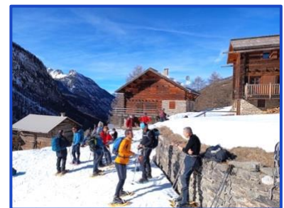
Le départ après la pause

5 h 30 de marche dénivelé + 520 m – 520 m