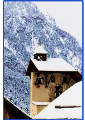
Le clocher de Ceillac

Au départ de Ceillac la remontée de la vallée du Cristillan offre de beaux points de vue sur des espaces sauvages et préservés, les hameaux disséminés témoignent du pastoralisme d'autrefois.